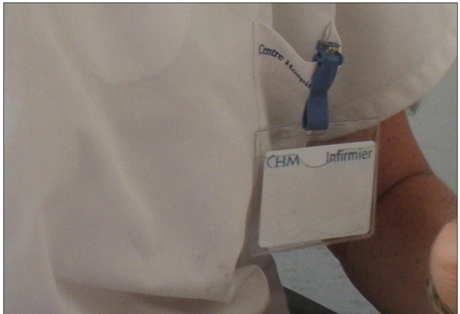
La législation évolue peu à peu

* Les communautés professionnelles territoriales de santé (CPTS) regroupent les professionnels d'un même territoire qui souhaitent s'organiser autour d'un projet de santé pour répondre à des problématiques communes