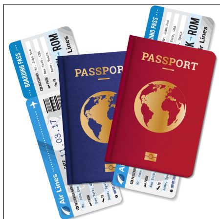
Le coût trop élevé des billets d'avion entre les DROM-COM et la Métropole est aussi une problématique pour les fonctionnaires ultramarins et leur famille

acceptable renforçant ce schisme avec la Métropole au regard d'un paradoxe qui vise toujours les populations ultramarines à réclamer leur pleine identité et appartenance française. Du côté des autres membres pluripartisme du camp défavorable, la notion de priorité égalitaire des chances au regard d'un poste à pourvoir a été évoquée; fondement même de la République.