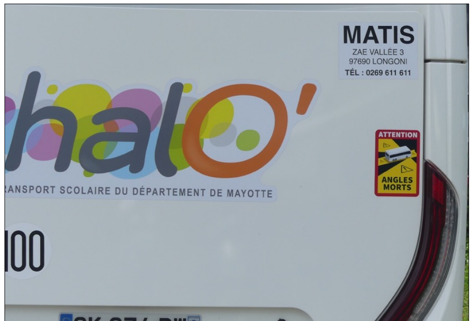
Le transport scolaire dans un angle mort pour le Département