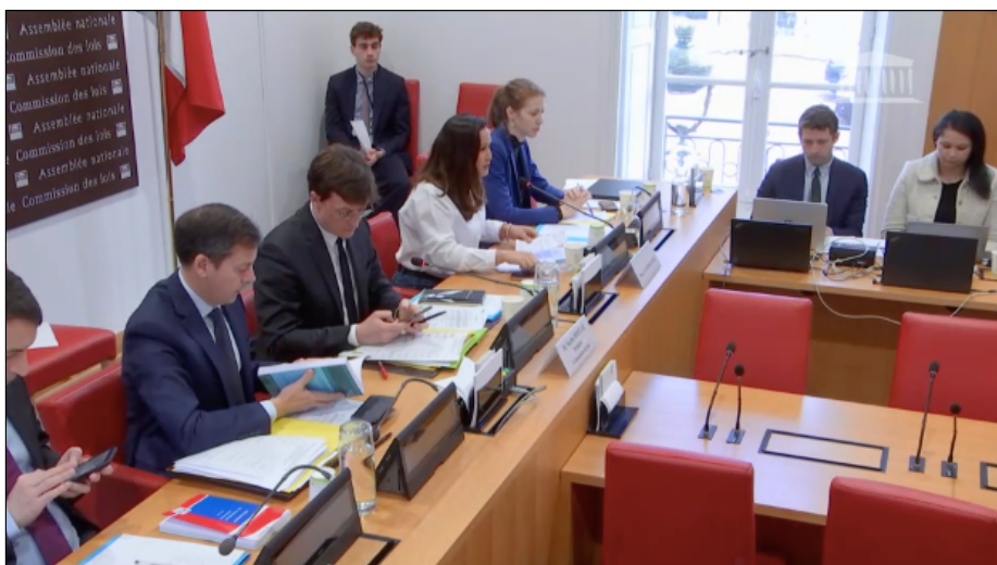
Selon l'Insee, à la Réunion, 11% des poste cadres sont occupés par des réunionnais et 50% par des métropolitains.

Cette proposition de loi en l'état viendrait un aspect néfaste, déjà existant en territoires ultramarins, de renforcement de l'identitarisme au profit d'un recrutement exclusivement pro-local appelé selon ses propres termes « l'emploi local-localisé » qui se réduit à échelle départementale et même communal. L'identité devenant de fait, une compétence , ce qui n'est pas