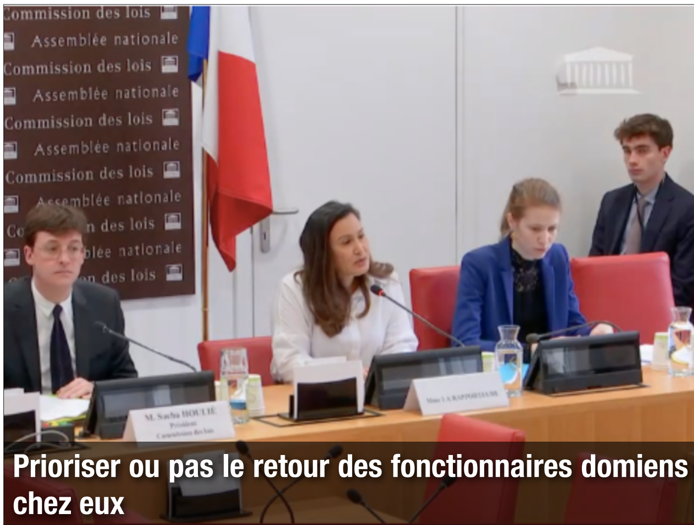
Prioriser ou pas le retour des fonctionnaires domiens chez eux