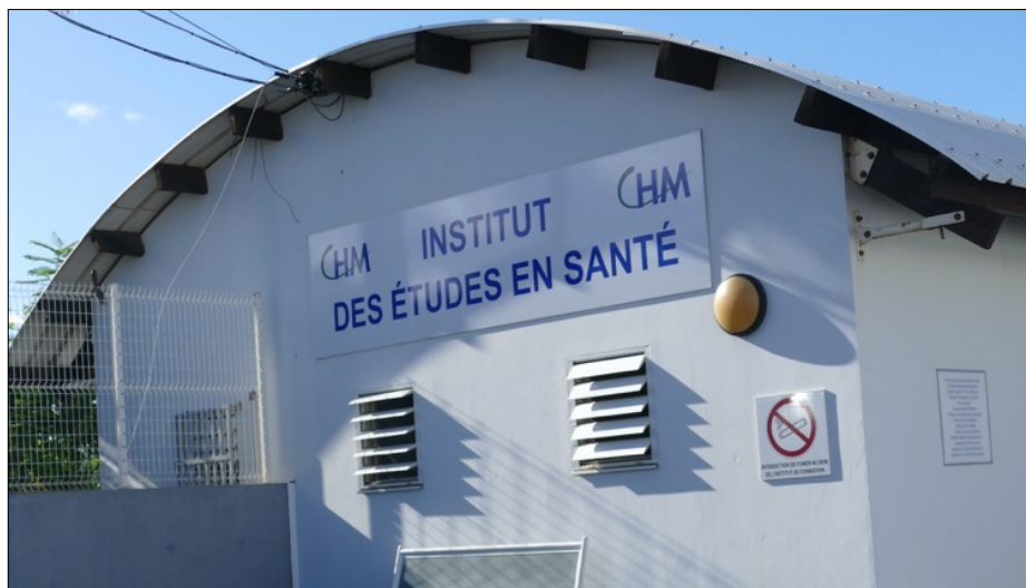
L'Institut d'études en santé à Mamoudzou

Pour ouvrir un peu plus le champ des possibles, les députés et sénateurs ont autorisés un accès direct à l'ensemble des IPA dans quatre départements test qui seront désignés ultérieurement, et pour une période de 5 ans.