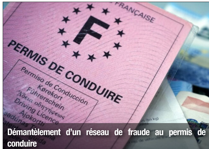
Démantèlement d'un réseau de fraude au permis de conduire