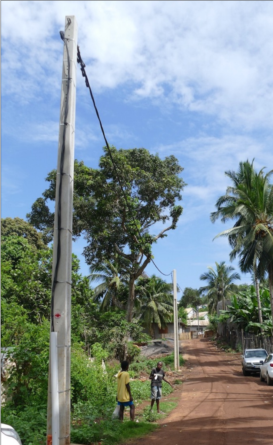
Un gros retard à rattraper en terme d'électrification rurale

Le conseil économique présidé par Abdou Dahalani, revient sur son étude du « Qui fait quoi ? », en rappelant le juste partage des tâches et des finances qui vont avec, notamment sur l'absence de compensation pour