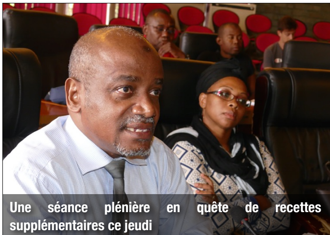
Une séance plénière en quête de recettes supplémentaires ce jeudi