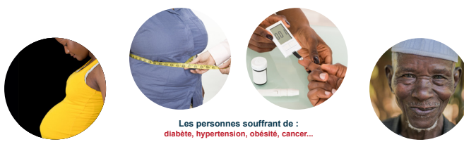
Les femmes enceintes