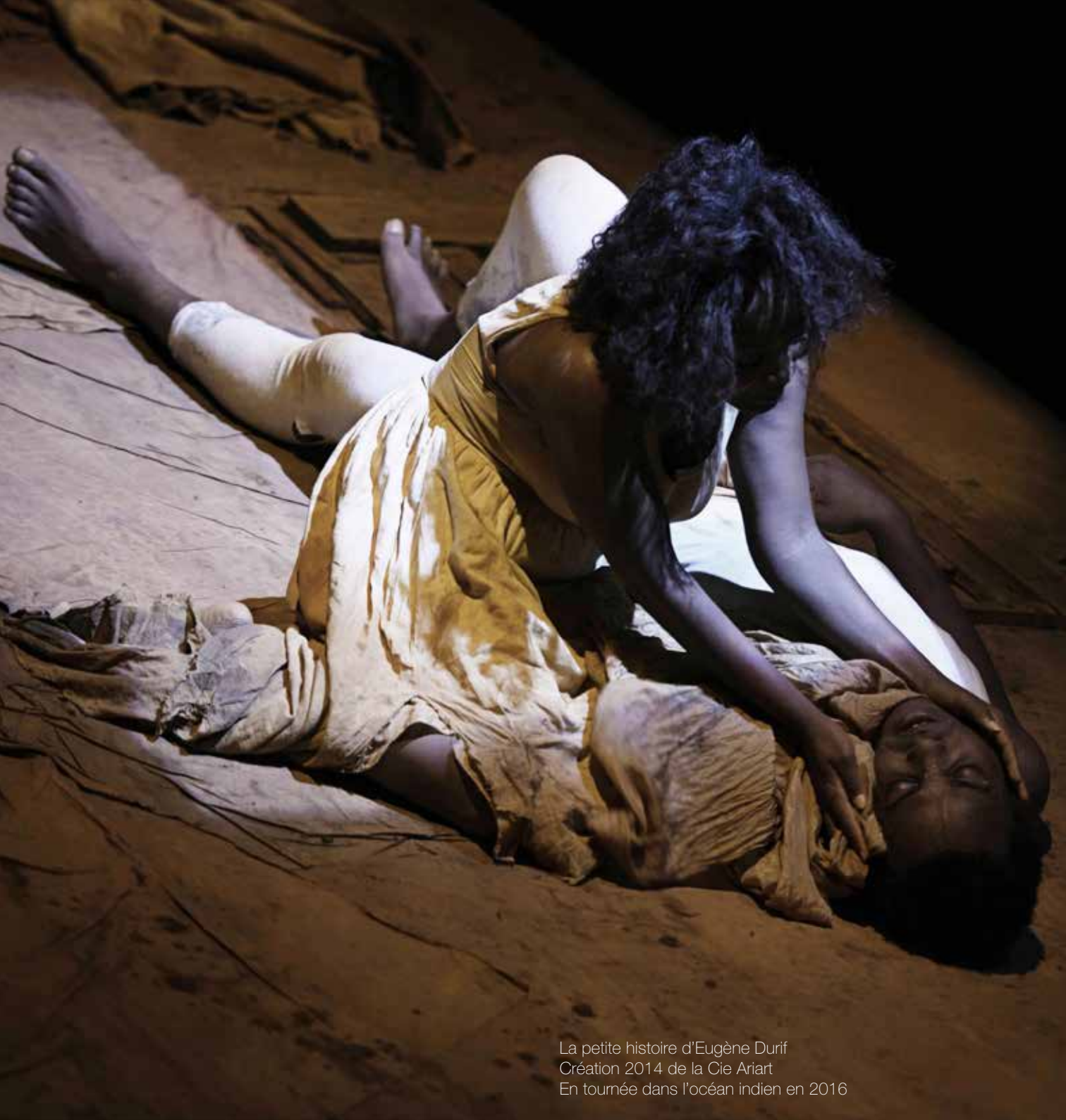
La petite histoire d'Eugène Durif Création 2014 de la Cie Ariart En tournée dans l'océan indien en 2016