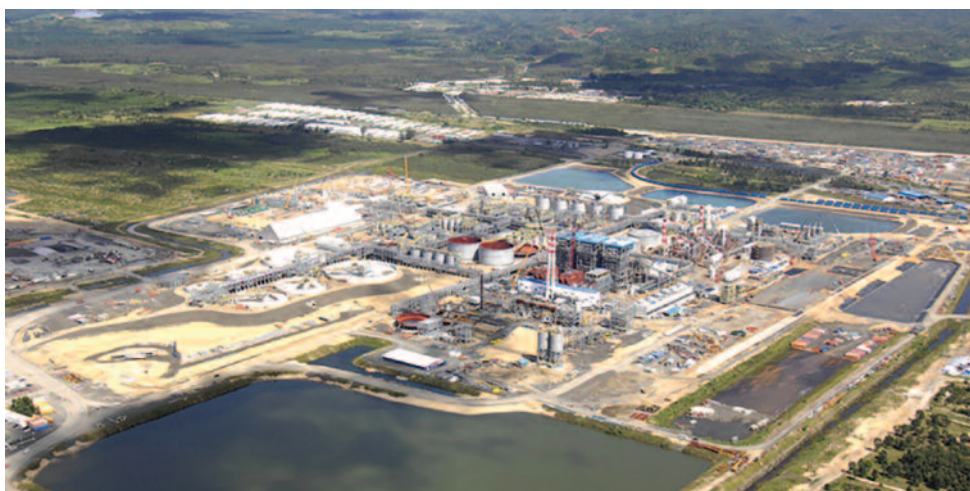
L'usine du site minier d'Ambatovy, à l'est de Madagascar. Les mines ont tiré la croissance de 2,6% enregistrée en 2013 et de 3,7% annoncée pour 2014.

L'économie réunionnaise est aujourd'hui dominée par des entreprises appartenant à des multinationales ou à des groupes français, comme le montre notre classement avec Vindémia et Groupe Bernard Hayot en première ligne. Seuls quelques groupes familiaux, à capitaux réunionnais, comme Excellence, Ravate, Océinde et Chong-Fah-Shen, occupent encore des positions significatives. Mais force est de constater que la départementalisation a façonné l'économie de l'île tout autant que son organisation administrative. C'est un peu le même problème à Madagascar, pour des raisons différentes, alors que Maurice a réussi, au contraire, à garder la main sur son économie. Les leaders des principaux secteurs de l'économie mauricienne sont des entreprises à capitaux mauriciens ou contrôlées par des acteurs mauriciens, y compris le secteur bancaire dominé par la MCB. Des groupes comme CIEL ont su habilement faire entrer dans leur capital des fonds d'investissement internationaux tout en gardant le contrôle, au moins en droits de vote.