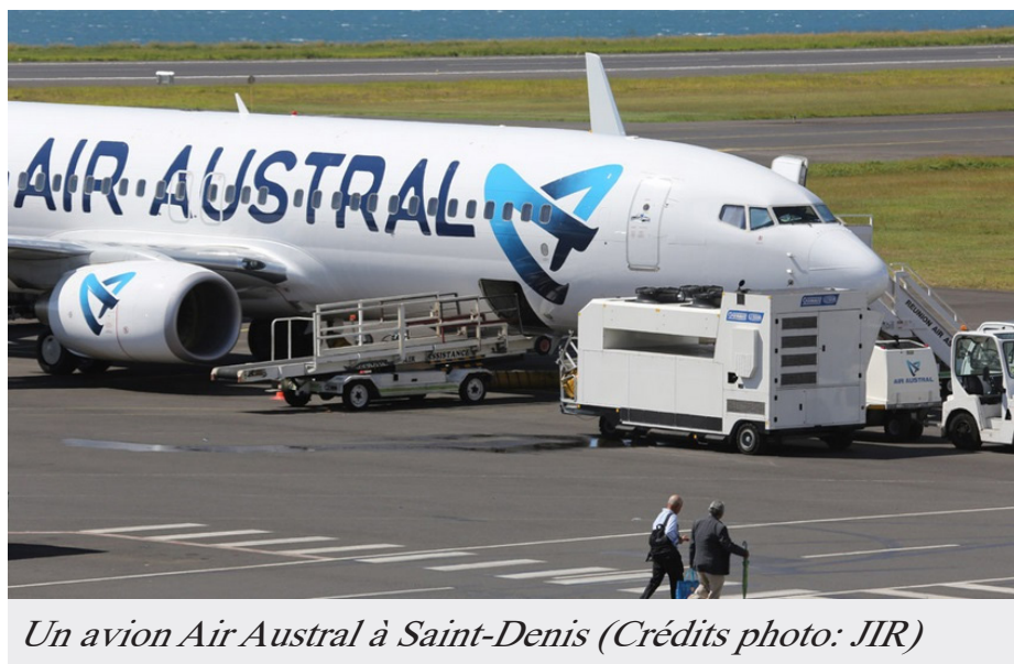
Un avion Air Austral à Saint-Denis

Alors que la grève démarre demain vendredi, Air Austral diffuse le programme de ses vols pour ces vendredi 29 et samedi 30 janvier.