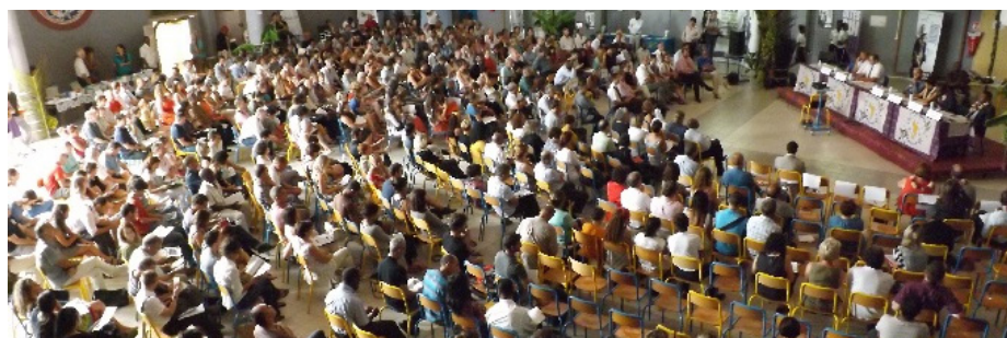
Accueil des nouveaux enseignants par le Vice-rectorat

La ministre de l'Education nationale a publié les affectations de postes supplémentaires sur l'ensemble des départements français : Mayotte est bien dotée, mais toujours touchée par les difficultés de recrutement.