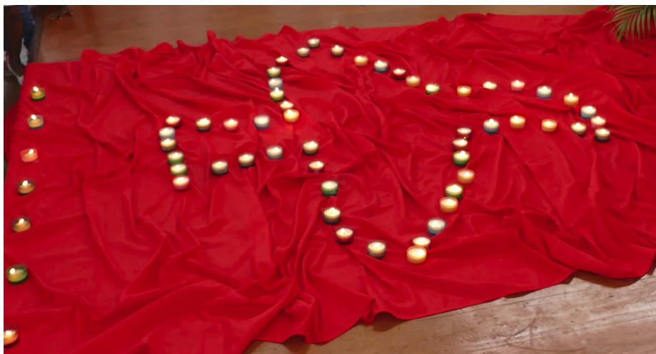
Une colombe d'après Déluge

Les catholiques de Mayotte ont rendu eux aussi ce dimanche un hommage aux victimes des attentats à Paris, et se sont associés par la prière à leurs familles. En interpellant sur la construction d'un monde plus juste.