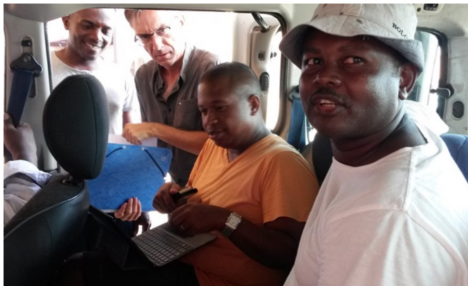
L'intersyndicale peaufine son message pour affirmer sa solidarité avec la nation

Les réactions ont été nombreuses à Mayotte depuis la vague d'attentats de Paris. La dernière en date, celle de l'intersyndicale qui suspend le mouvement toute la semaine prochaine.