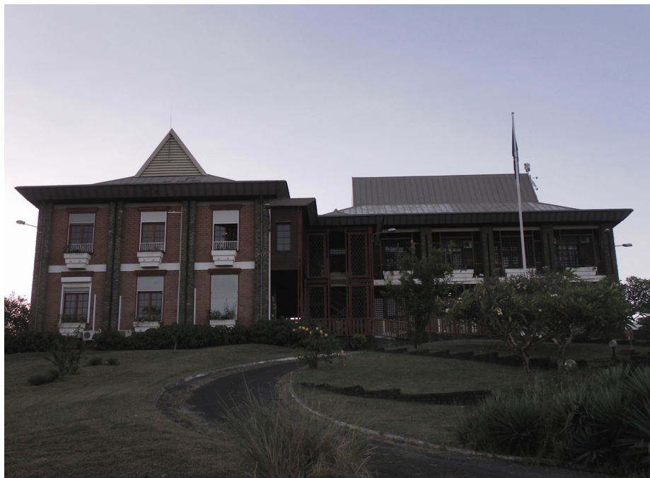
La Préfecture de Mayotte

La préfecture de Mayotte vient d'adresser aux médias les conclusions de l'état major de sécurité s'est tenu en début d'après-midi sous la présidence du Préfet et du Procureur de la République, en présence de l'ensemble des services de sécurité, de renseignement et des forces armées.