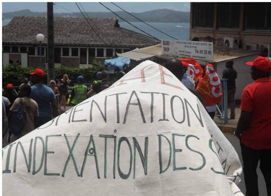
Une banderole pour l'augmentation de l'indexation le 3 novembre dernier à Mamoudzou

Alors que l'intersyndicale a suspendu le mouvement «tout au long de la semaine», la réévaluation de l'indexation continue de faire partie des revendications. L'Etat promet de se pencher sur le taux en 2017, après une étude de l'INSEE... qui pourrait ne jamais aboutir totalement. Explications.