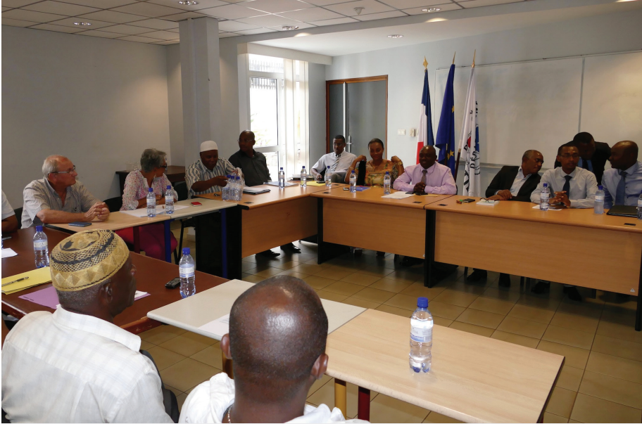
Dirigeants et salariés de la SMART en discussion avec les élus

Dirigeants et salariés de la société SMART se sentent lâchés par les élus du conseil départemental. Qui ne savent pas comment se dépêtrer de la situation, autrement qu'en prêchant le compromis.