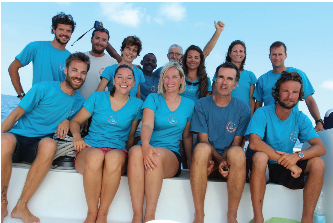
L'équipe scientifique et leur équipage en mission aux Glorieuses

travail de dépouillement mais ils seront précieux pour décrire leur quotidien. D'autant que ces tortues ont également été équipées de balises Argos. Les scientifiques ont ainsi déjà pu déterminer les zones qu'elles privilégient pour dormir et ils devraient encore, pendant de longues semaines, recevoir les signaux de leurs déplacements aux Glorieuses et bien au-delà dans l'Océan indien.