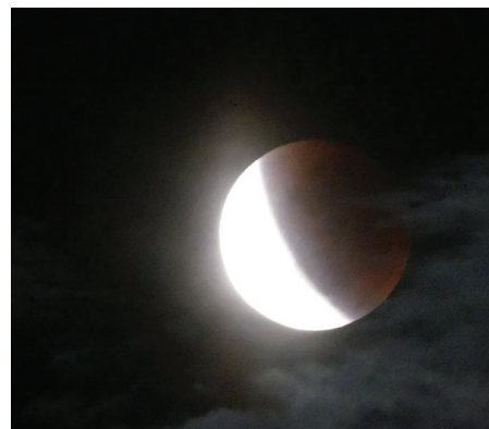
Éclipse de Super lune en cours

Entre 5h et 6h du matin à Mayotte, le ciel promettait de nous offrir un beau spectacle avec une éclipse de lune. Mais par n'importe quelle lune : une Super lune, au plus près de notre Terre. Un phénomène qu'on ne reverra pas avant 2033.