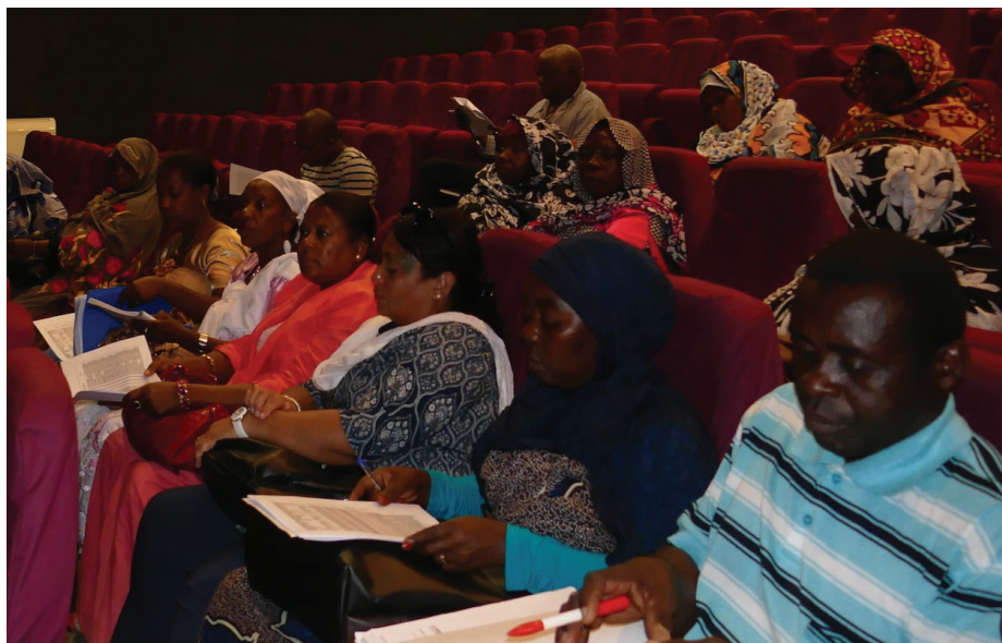
Les quelques agents territoriaux présents

Sur 3.600 agents concernés par une intégration dans la fonction publique, ils n'étaient qu'une vingtaine à avoir répondu à l'appel d'une intersyndicale des 4 syndicats majoritaires. Il s'agissait pourtant aussi de profiter du contexte de la réunion de ce vendredi au ministère de la fonction publique pour exercer une pression sociale.