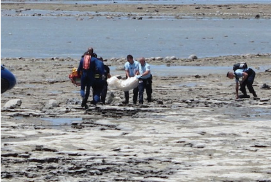
Enlèvement des corps par la gendarmerie

Cette nuit, un nouveau naufrage a endeuillé les îles d'Anjouan et Mayotte. Sans que l'on sache vraiment estimer le nombre de bateaux qui arrivent sur l'île, ni chiffrer le nombre de décès. Nous avons obtenu malgré tout des précisions sur les circonstances du naufrage.