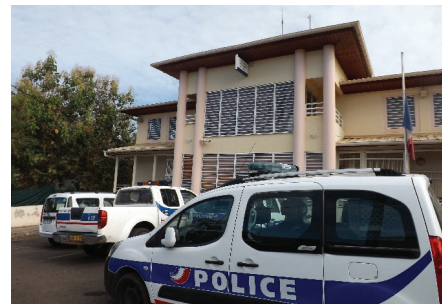
Le commissariat de Mamoudzou

Quand on n'a pas envie de se faire contrôler en conduisant un scooter, mieux vaut avoir son casque ! Jeudi dernier, le 10 Septembre 2015 à 23h30, les policiers de la Brigade Anti-Criminalité demandaient à un cyclomotoriste démuné de casque de s'arrêter... Il aurait ainsi pu justifier également l'absence de plaque d'immatriculation sur son deux-roues.