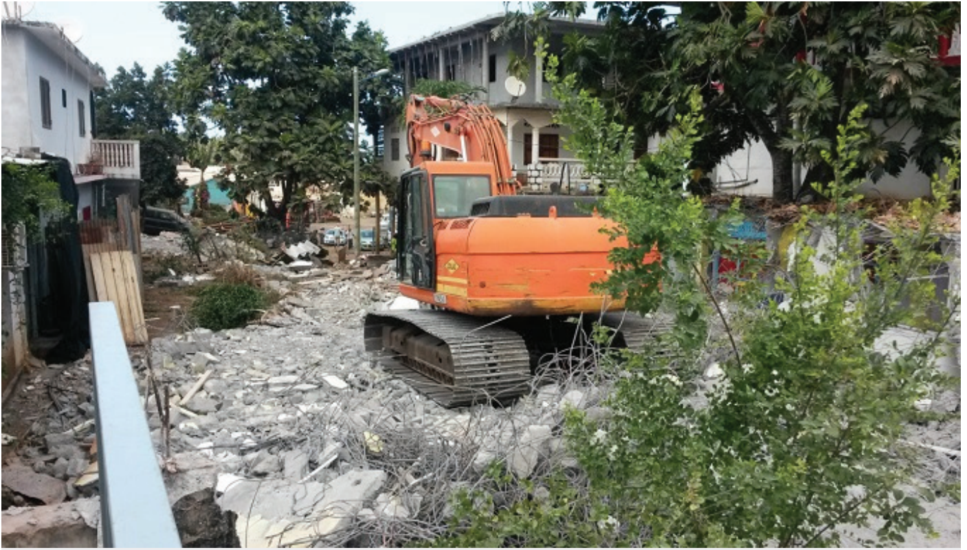
Rue du commerce : le percement d'un nouveau carrefour vers Mgombani

Le chantier de rénovation du quartier de Mgombani connaît une nouvelle phase depuis ce lundi. Le boulevard du baobab va bientôt être relié à la rue du commerce.