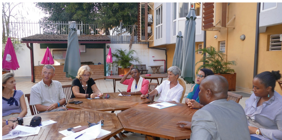
Comité de pilotage des acteurs des Évacuations sanitaires

Le verdict de la Chambre régionale des Comptes sur les évacuations sanitaires (Evasan) vers La Réunion avait été sévère : il pointait à la fois un manque de coordination et des pertes financières pour le CHU réunionnais. Tous les acteurs ont leur part de responsabilité. Ce qui fut débattu ce lundi en Comité de pilotage Réunion-Mayotte, avec des ébauches de solutions.