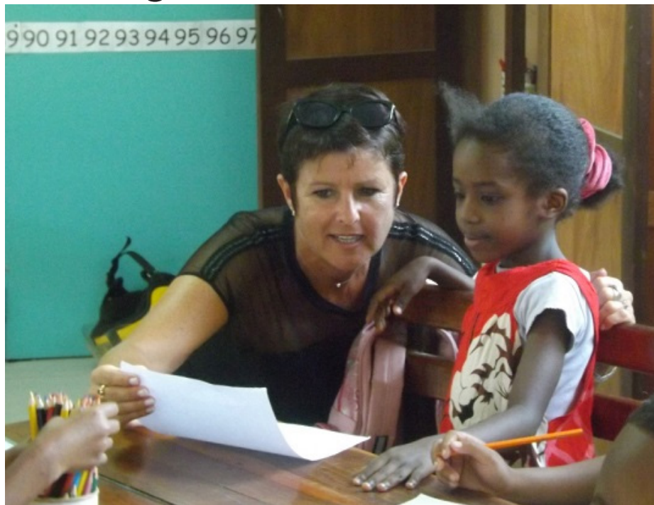
50.500 élèves dans le 1er degré