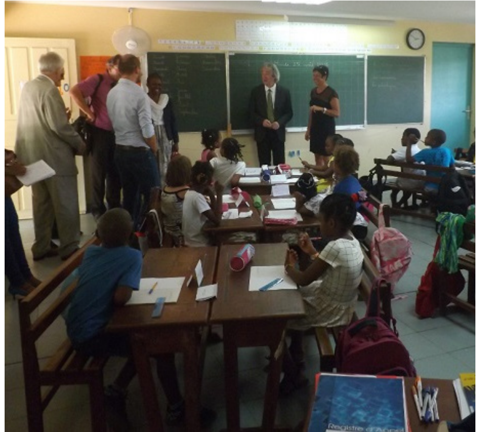
Dans une classe de Pamandzi en ce jour de rentrée scolaire

Mayotte reçoit la visite du délégué général à la langue française et aux langues de France. Il rédige un rapport commandé par le Premier ministre sur la maîtrise du français sur l'ensemble du territoire. A Mayotte, la question mobilise enfin.