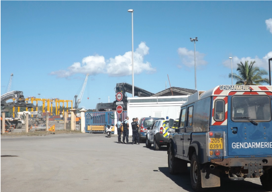
Les forces de l'ordre devant l'entrée bloquée du port, avec en arrière plan les grues installées par MCG

L'accès au port était totalement bloqué ce mercredi matin. L'ambiance est tendue pour le démarrage de ce conflit social. Après des violences exercées contre le capitaine du port la nuit dernière, l'huissier dépêché par MCG a été brièvement bousculé ce matin.