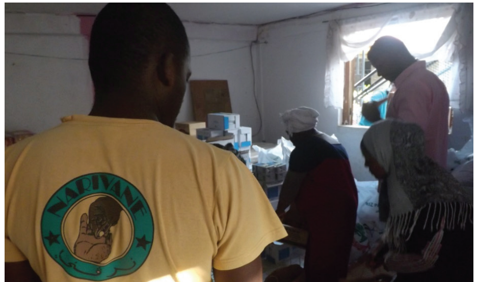
Narivane: après la distribution pendant les périodes de ramadan, l'association veut faire de l'information

Les associations Narivane et Uzuri wa Malesi de Sada organisent la semaine prochaine conférence et formation sur la Zakat et la finance islamique à Sada. Leur objectif : informer sur les obligations religieuses liées à l'argent et apprendre aux musulmans de Mayotte à donner.