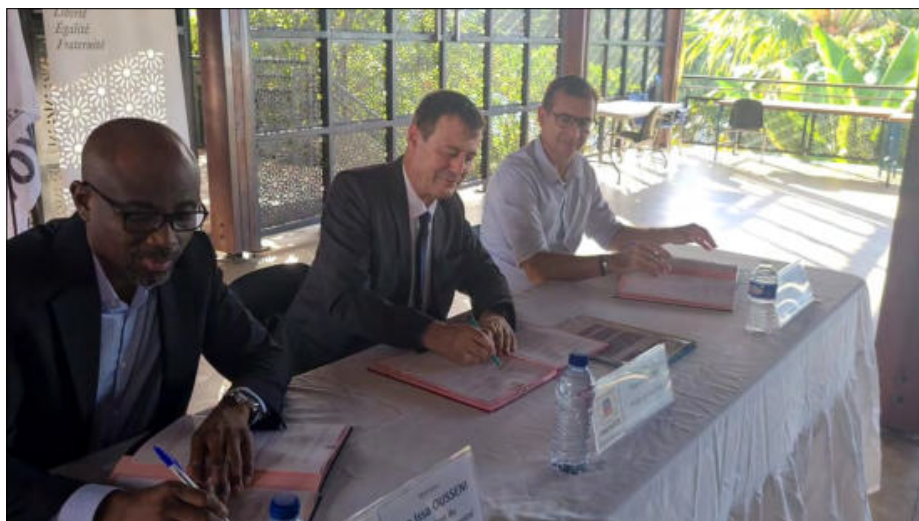
Signature en présence du préfet de Mayotte Thierry Suquet

Liste globale des produits et magasins concernés par ce BQP+ 2023