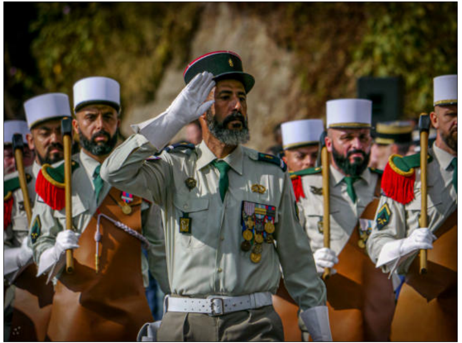
Les fameux pionniers de la Légion étrangère reconnaissables à leur démarche lente, leur barbe et leur tablier