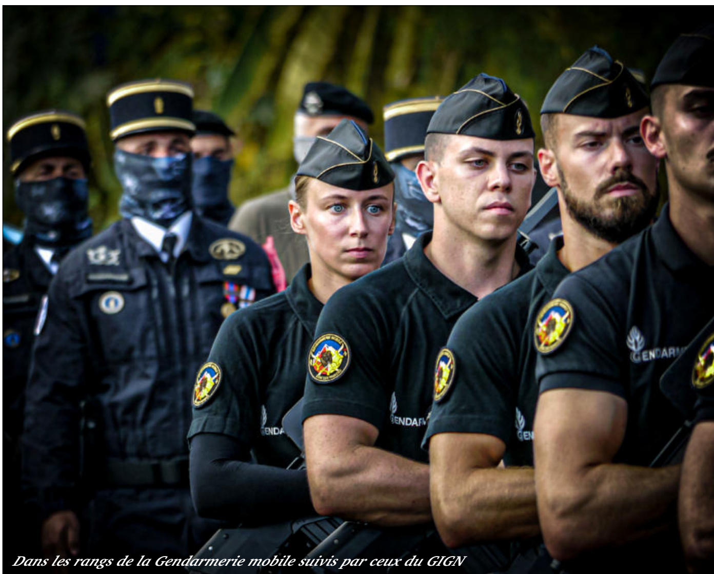
Dans les rangs de la Gendarmerie mobile suivis par ceux du GIGN