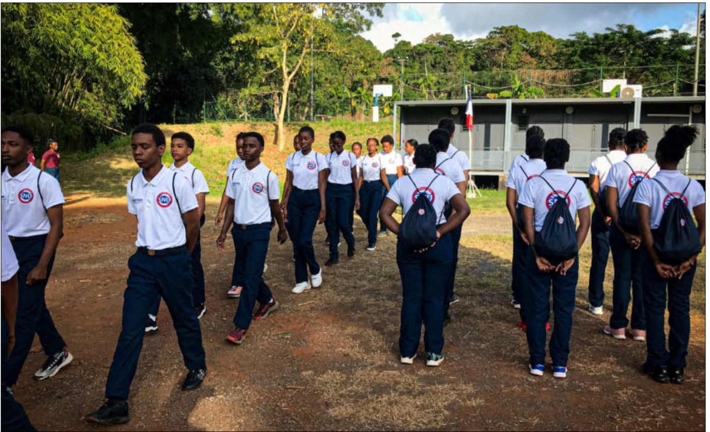
C'est naturellement dans l'ordre et le silence que le déroulé de cette matinée se passe

ment d'une semaine au minimum et deux semaines au maximum, au profit d'une association ou d'une collectivité publique, afin de pouvoir se mettre bénévolement au service de la société.