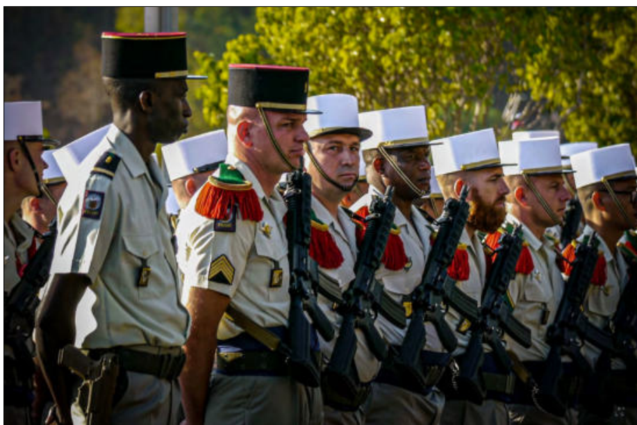
Attente et stress palpable d'avant défilé