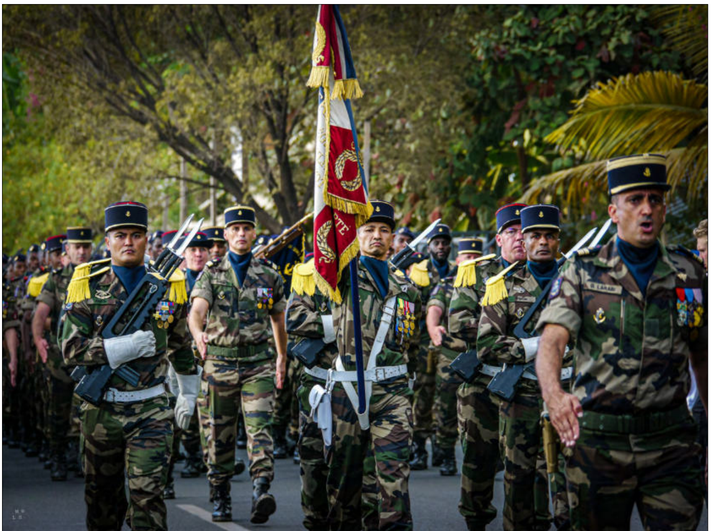
Porte-drapeau du Régiment du Service Militaire Adapté de Mayotte