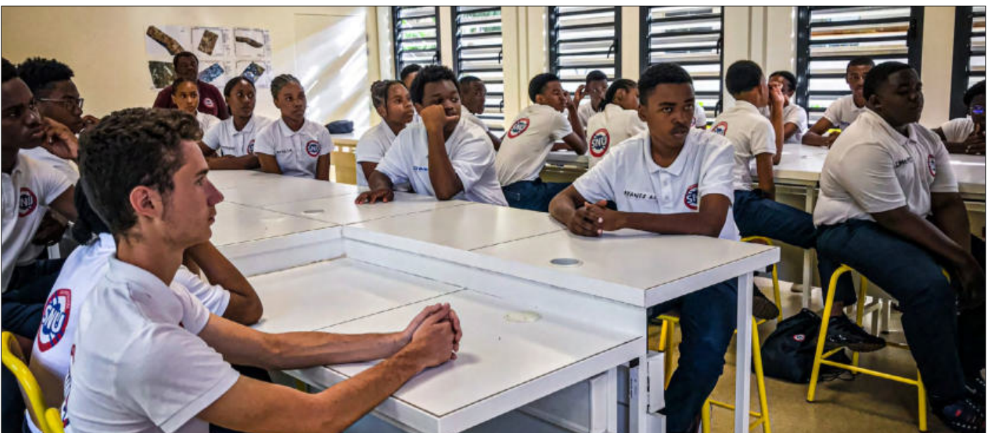
Des cours instructifs et d'actualité qui ont le mérite de capter l'attention

*La Délégation régionale académique à la Jeunesse, à l'Engagement et aux Sports (DRAJES)