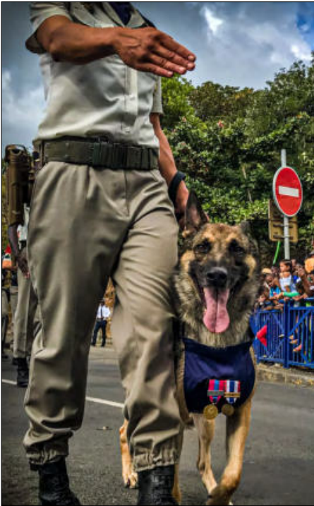
Les militaires canins sont aussi à l'honneur