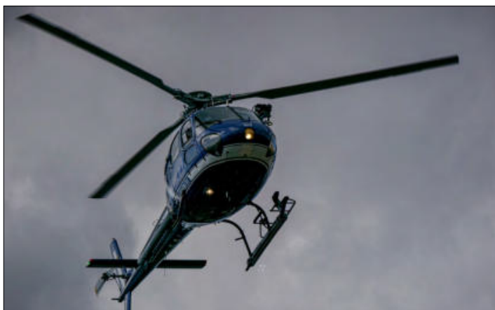
Un défilé clôturé en beauté par le souffle aérien et hélicoptéré de la Gendarmerie nationale