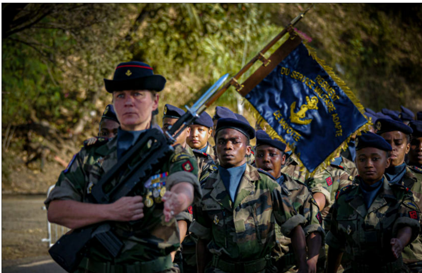
Les jeunes recrues du RSMA avaient fière allure