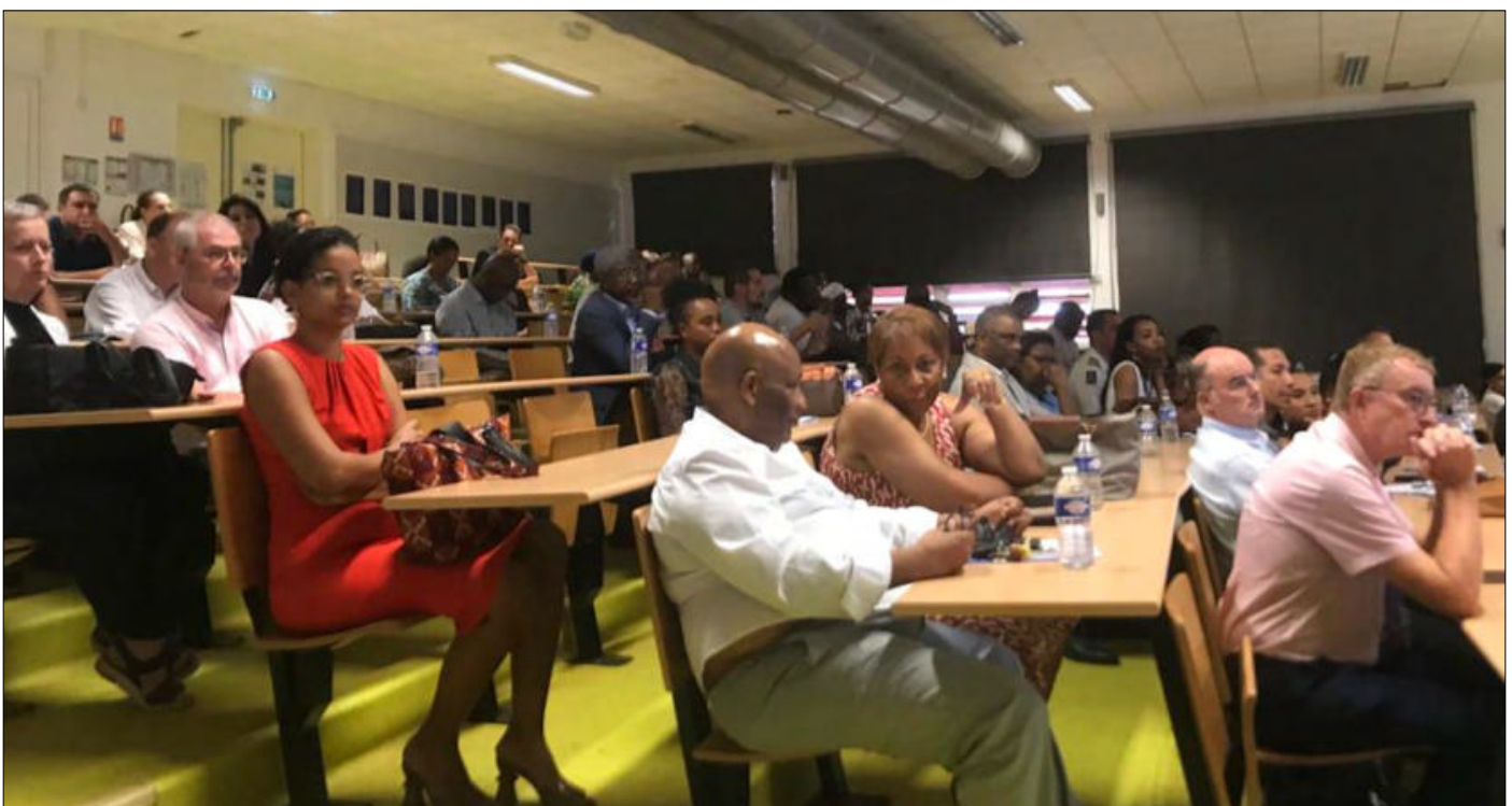
De nombreux chefs d'établissements du Second degré étaient invités à cette réunion