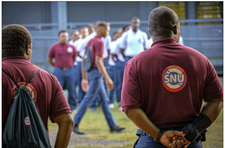
Passage en revue des volontaires par leurs 15 encadrants avant la traditionnelle levée des couleurs de 8h, rituel d'amorce d'une journée d'activité

Intégrés depuis le 4 juillet dernier, les heureux sélectionnés sur dossier,