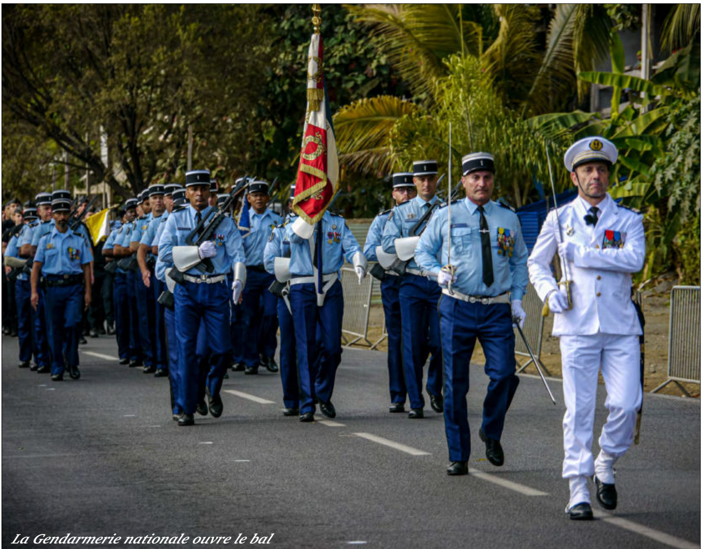
La Gendarmerie nationale ouvre le bal