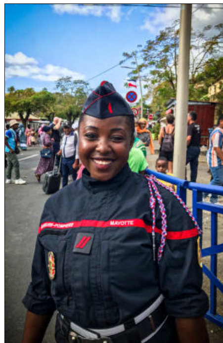
Caporal et sapeur-pompier au Sdis976 depuis 8 ans "C'est mon 7ème défilé mais on ne peut pas être blasée, le stress est toujours un peu présent, surtout lorsque la famille est venue pour te voir mais bien sûr qu'on est nourrie de fierté"