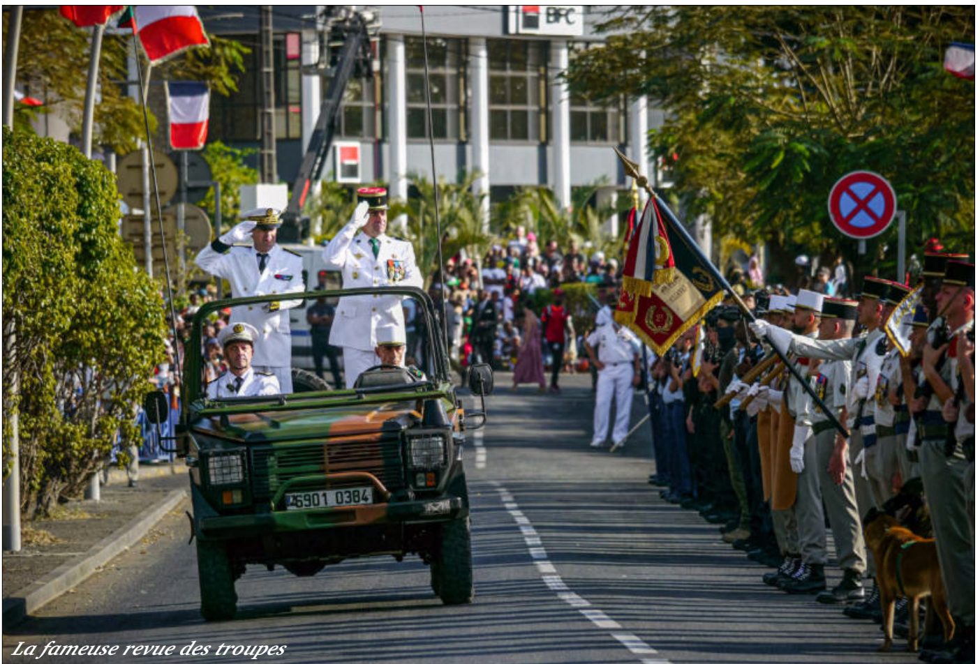
La fameuse revue des troupes