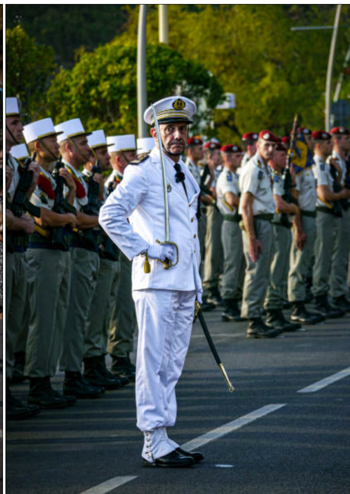
À quelques minutes de l'ouverture de ce défilé militaire de Mayotte 2023