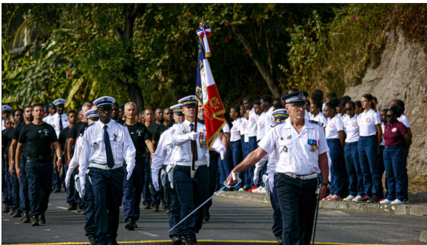
Les effectifs de la Police nationale