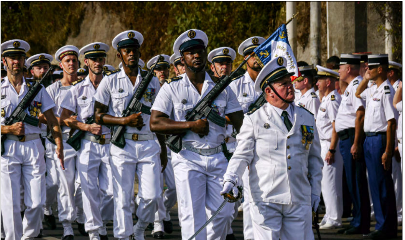
La Marine nationale