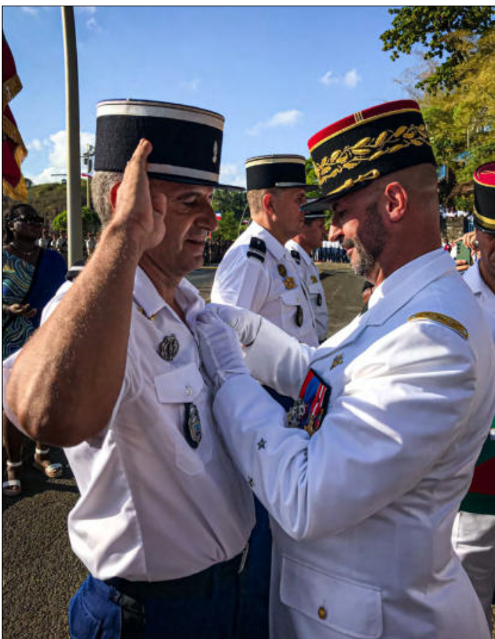
Remise de décoration par le général O. Capelle