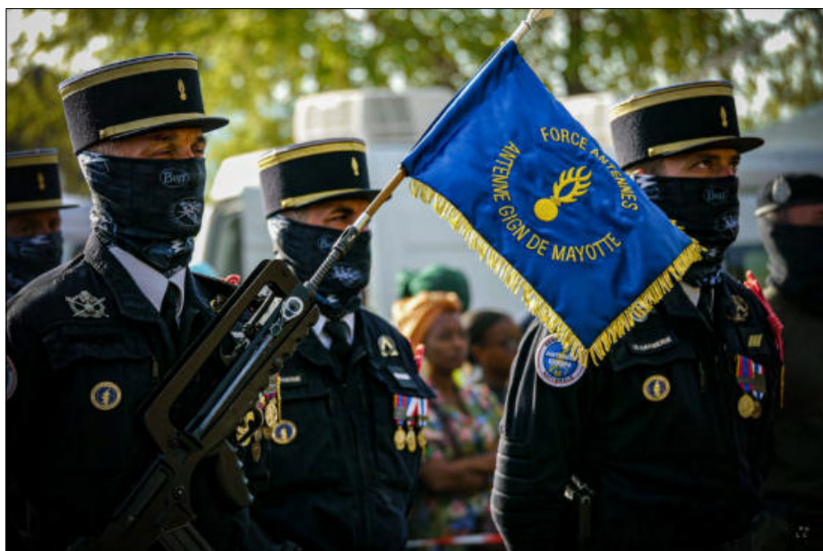
Les troupes du GIGN, antenne de Mayotte

Contact commercial : +33.7.85.05.96.59 pub@lejournaldemayotte.com