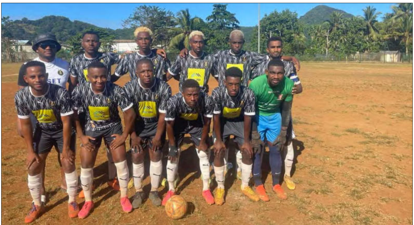
Combani continue sa marche en avant, en sous-marin