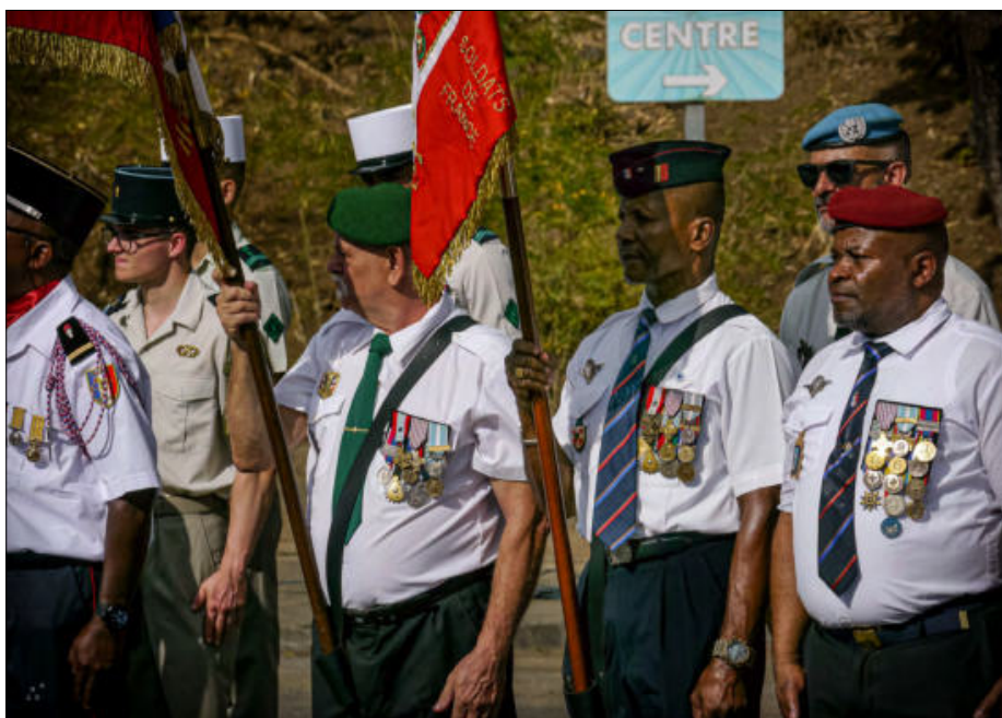
Hommage aussi à nos anciens combattants et vétérans