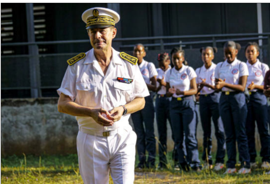
Applaudi par les jeunes du SNU, le préfet a adressé un discours introductif très émouvant en l'honneur de Jean Moulin et de réaliser l'importance et la chance de vivre en un pays libre

noble symbolique de ce beau projet , visant la pleine conscientisation des notions de Partage, de Solidarité et de Citoyenneté, il est à noter que ce dispositif se veut porté par 3 ministères que sont l'Éducation nationale, l'Intérieur mais également des Armées qui alimente une grande composante de ce séjour.