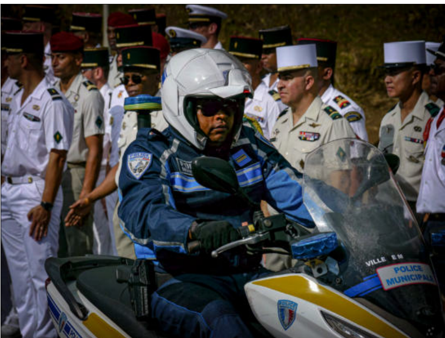
Les unités motorisés de la Police municipale