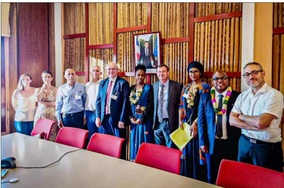
Entretien de la délégation ML nationale avec le préfet, ses adjoints ainsi que les services de la Deets

Malheureusement à l'époque, sous l'ancienne mandature, cela n'a pas eu de suite. L'actuelle équipe s'est engagée à reprendre en main ce dossier pour enfin mettre en application cette convention, redéfinissant par la même occasion, les missions qui nous incombent notamment sur le volet d'une partie des mineurs issus de l'Aide sociale à l'enfance ». Un volet qui n'est pas des moindres sachant la complexité et les dysfonctionnements que cela représente pour le Conseil départemental justement. En plus des actuelles missions des plus denses déjà en cours, c'est donc la prise en charge des bénéficiaires du RSA