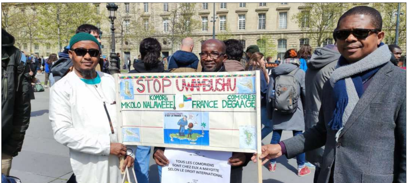
Une des manifestations qui s'est tenue ce dimanche

Tout en annonçant la mise en place de la Fédération Reconquête de Mayotte,