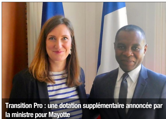
Transition Pro : une dotation supplémentaire annoncée par la ministre pour Mayotte