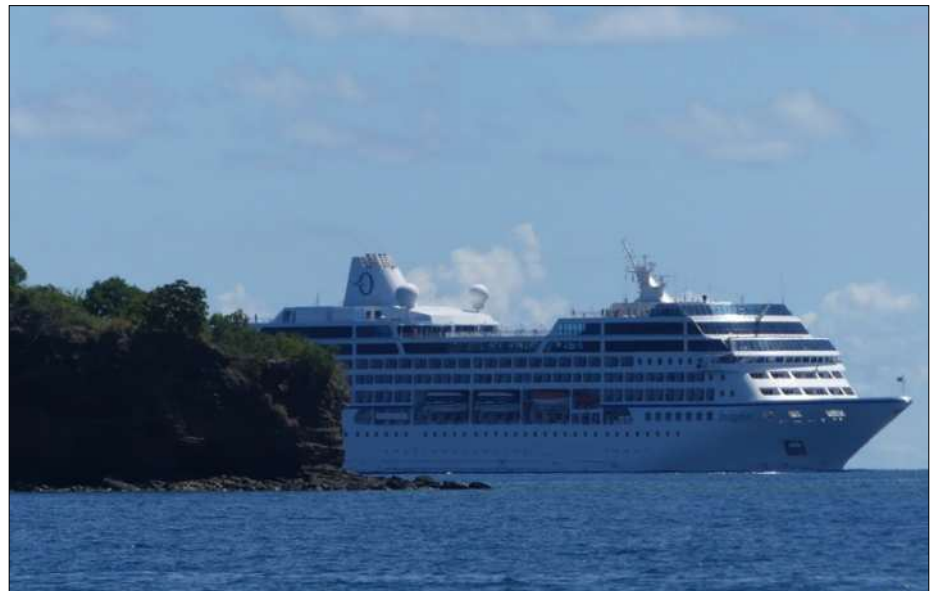
Arrivée du paquebot Insignia en fin de matinée ce vendredi

Le navire de 684 passagers sera resté au mouillage de 11h à 19h. Long de 180 mètres, il affiche des cabines luxueuses dont presque 70% possèdent une véranda privée, et 342 suites de grand standing. A bord, quatre restaurants, un salon de massage, un espace Spa et wellness, un salon de beauté, un centre fitness, des bars et lounges, un casino, une salle de jeux, une boutique, une piscine avec whirlpool, et une bibliothèque.