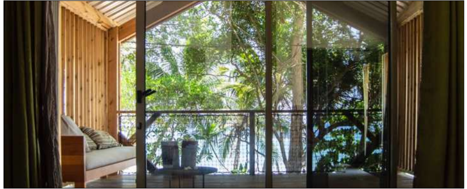
Le Jardin Maore fait peau neuve

La première phase de transformation du Jardin Maore sera inaugurée le vendredi 9 juin en présence des institutionnels et partenaires du projet : nouveaux bungalows, chambres, bar de plage et centre nautique « Le Lagon Maore », seront au programme.