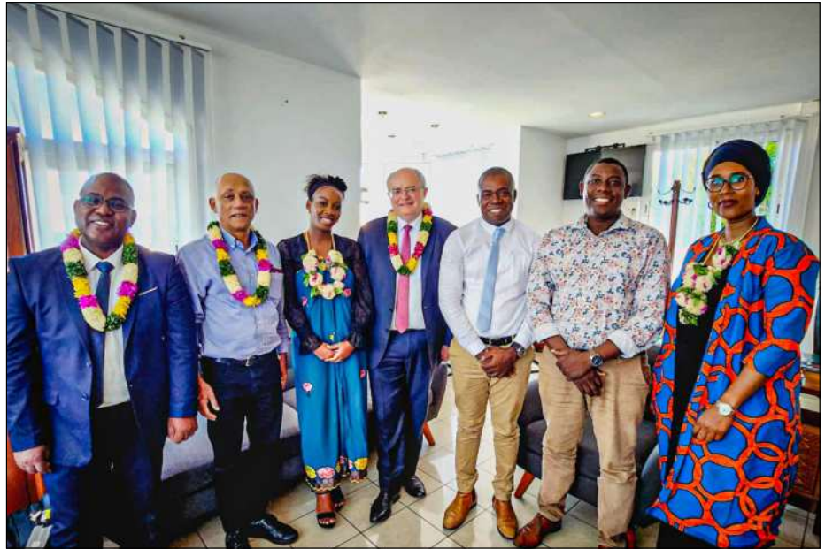
Entretien en le Conseil départemental et la délégation nationale Mission locale

C'est donc en ce 1er semestre 2023 que différents séminaires se sont organisés, notamment celui de la zone océan Indien, le 11 avril dernier à la Réunion, afin de présenter les grands axes, outils et points clés qui seront pris en compte dans ce lancement de démarche de labellisation et de notation. Une notation basée sur 35 critères clés notés de 1 à 4 pour lesquels