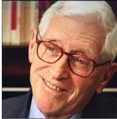
Bertrand Schwartz, père fondateur des Missions locales, décédé le 30 juillet 2016

Au constat d'une dégradation marquée de l'emploi, notamment auprès des jeunes de plus en plus nombreux à être au chômage, c'est le 15 septembre 1981, que le 1er Ministre du Gouvernement de l'époque, Pierre Mauroy , décide de