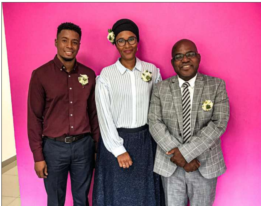
Représentation de la pièce Une chambre en Inde, par la célèbre troupe du Théâtre du Soleil®