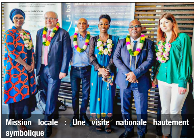
Mission locale : Une visite nationale hautement symbolique