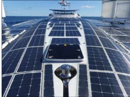
Les superstructures sont entièrement recouvertes de panneaux solaires

A l'origine du projet, Victorien Erusard, officier de marine marchande et